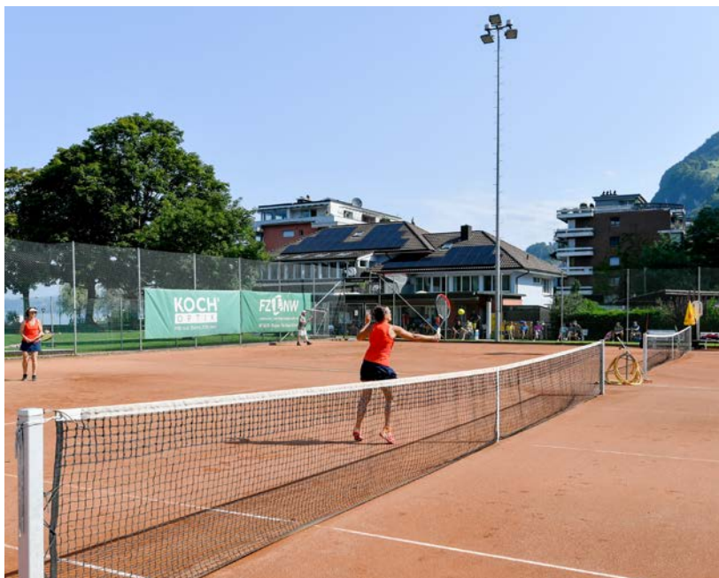
Die Beläge der Tennisplätze in Stansstad haben das Ende ihrer Lebensdauer erlebt. Nun sollen sie schon bald saniert werden.

Andy Schaub erwähnte nochmals die privilegierte Lage, die dem Tennisclub in den letzten Jahren einen ungeahnten Boom beschert hat – Ende 2023 zählte der Verein 207 Aktiv-Mitglieder, so viele wie noch nie, Tendenz steigend. Künftig sollen auch alle Junioren, die an den regelmässigen Trainings teilnehmen, zu Klubmitgliedern werden. Mittlerweile zählt der Verein somit 221 Aktive, 67 Junioren und Juniorinnen und 23 Passive. Im Interclub trat der Verein diesen Frühling mit neun Teams an und hat damit die Kapazitätsgrenze erreicht. Der hinterste Platz 4, der bisher der