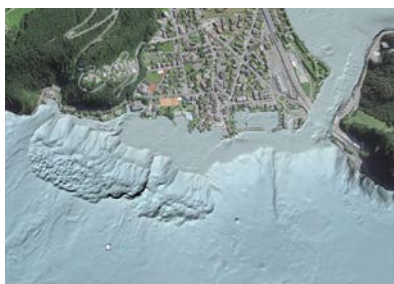
So präsentiert sich der Seegrund vor Stansstad.

Das Projekt wurde gemeinsam von den Zentralschweizer Kantonen Luzern, Nidwalden, Obwalden, Schwyz und Uri, der swisstopo und der Aufsichtskommission Vierwaldstättersee in Auftrag gegeben. Die