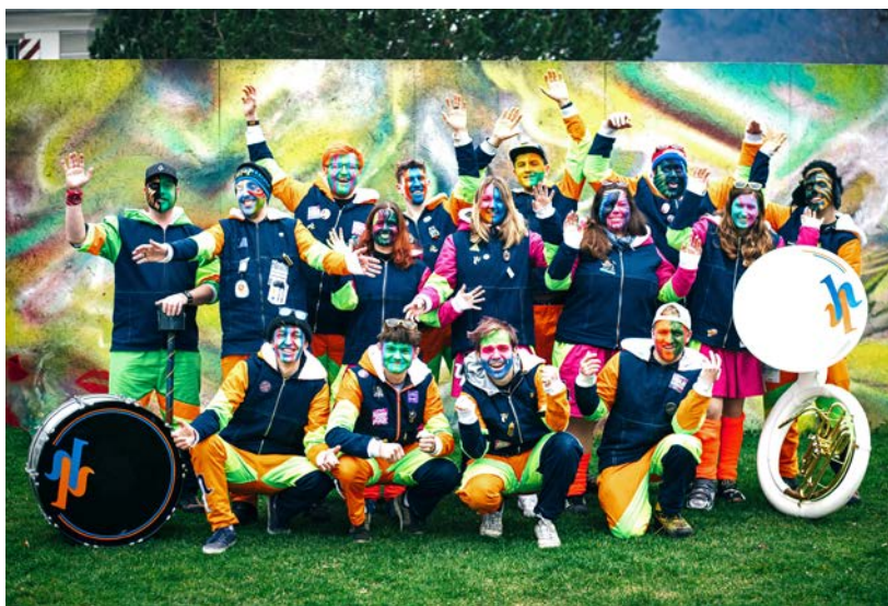
Klein, aber fein: Die Guugge Hüdä Hädä freut sich auf ihren runden Geburtstag im kommenden Jahr.

Am Anfang der Guugge Hüdä Hädä stand – eine Guuggenmusig: die Stansstader Schnitzturmfiger. In den achtziger und neunziger Jahren bildete diese Familienguuggenmusig das fasnächtliche Rückgrat in der Gemeinde Stansstad. Klein und Gross spielten im Familienverbund mit – unter ihnen auch Marc Vogt. «Es war eine durchaus grossartige und schöne Zeit – aber aus Kindern werden irgendwann junge Erwachsene. Und die wollen dann halt etwas mehr oder etwas Anderes als eine Familienguuggenmusig», blickt er auf die damalige Zeit zurück. Zu viert wollten sie ihre eigene Geschichte schreiben. «Und wir fassten gemeinsam den Entschluss, eine eigene Guuggenmusig zu gründen.» Das war 1995. Aber