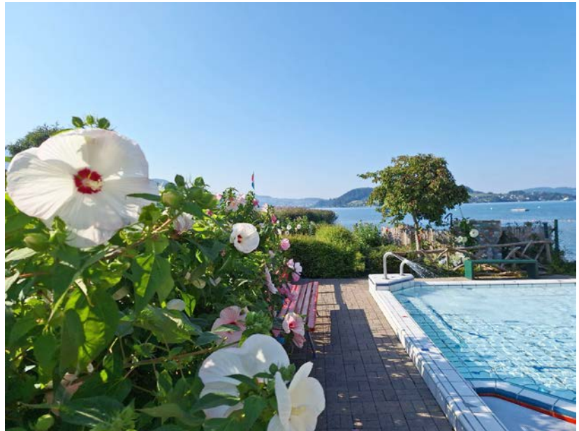
Nicht immer war der Sommer im Stansstader Strandbad so wunderbar blumig und sonnig wie auf diesem Bild.

Abgesehen von den Wetterkapriolen dieses Jahr haben wir aber aus der Badi nur Positives zu berichten. Es gab keine nennenswerten Unfälle oder Verletzungen, die Badewassertechnik läuft einwandfrei und auch die Zusammenarbeit im Team ist so gut wie noch nie. Während im Sommer viele Zeitungsberichte kursierten mit Frei-