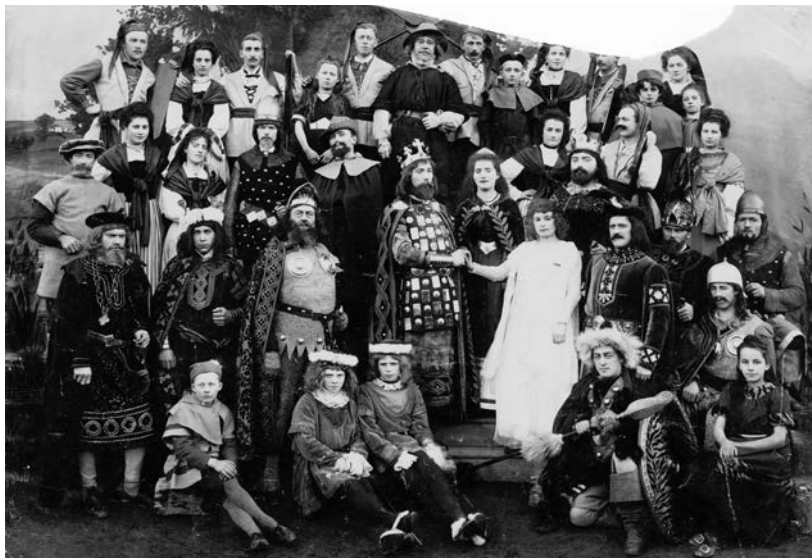
Egal, ob in Buochs um die vorletzte Jahrhundertwende (Bild) oder aktuell in Stansstad (siehe Kasten unten): Die Theaterkultur ist im Kanton Nidwalden und in der ganzen Zentralschweiz tief verwurzelt.

Nicht nur in Stansstad wartet der Theaterverein alljährlich mit einem Stück auf (siehe Kasten). Auch in zahlreichen anderen Nidwaldner Gemeinden und auch in den übrigen Inner-schweizer Kantonen ist die Theaterkultur oft tief verwurzelt. Wer Einblick nehmen möchte in die Geschichte und Gegenwart dieser Kultur kann dies derzeit im Salzmagazin Stans machen. Noch bis zum 27. Oktober lädt das Nidwaldner Museum unter dem Titel «Alles Theater! Spiel-lust auf der Theaterbühne» ein. Die Ausstellung lässt die Besucherinnen und Besucher das Theaterfieber am eigenen Leib erfahren. Schon an der Kasse Salzmagazin erhält jede Besucherin und jeder Besucher eine Rolle