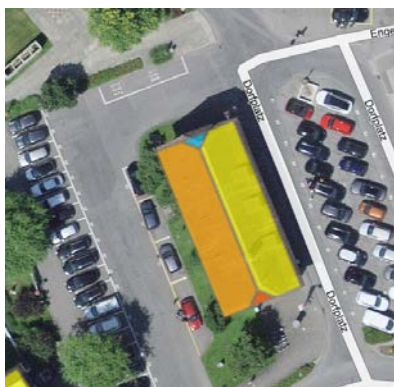
Für alle Gebäude in Stansstad (hier die Sust) können die «Solardaten» abgerufen werden.

oder was eine Solaranlage am entsprechenden Standort ungefähr kosten würde. Gibt man als Beispiel die Stansstader Sust ein (wo jedoch eine entsprechende Anlage aus Denkmal-