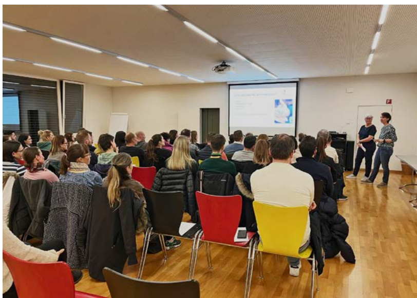
Erstmals veranstaltete die Schule einen Infoabend zum Thema Teilzeitkindergarten. Der Anlass stiess auf ein grosses Echo.

Nach den Präsentationen diverser Lehr- und Fachpersonen fand eine offene Fragerunde statt. Eltern hatten die Gelegenheit, ihre individuellen Fragen zu stellen und ein direktes Feedback von der Schulleitung und den anwesenden Lehrkräften zu er-