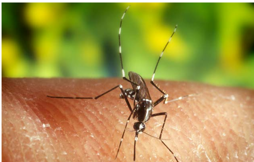
Die asiatische Tigermücke breitet sich aus. Mit verschiedenen Massnahmen kann dies gestoppt werden.

Die asiatische Tigermücke lebt vorwiegend im Siedlungsraum und daher nahe beim Menschen. Deshalb sollten folgende Vorkehrungen im Garten und ums Haus getroffen wer-