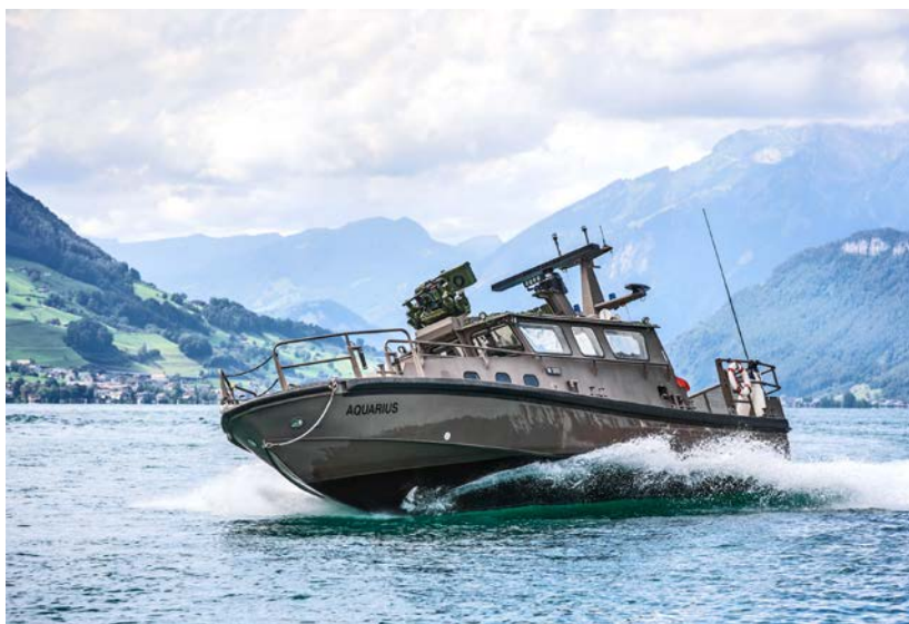
Auch auf dem Seeweg war während der Ukraine-Konferenz Mitte Juni kein Durchkommen. Die Patrouillenboote P16 schirmten die Zone vor dem Bürgenstock ab.