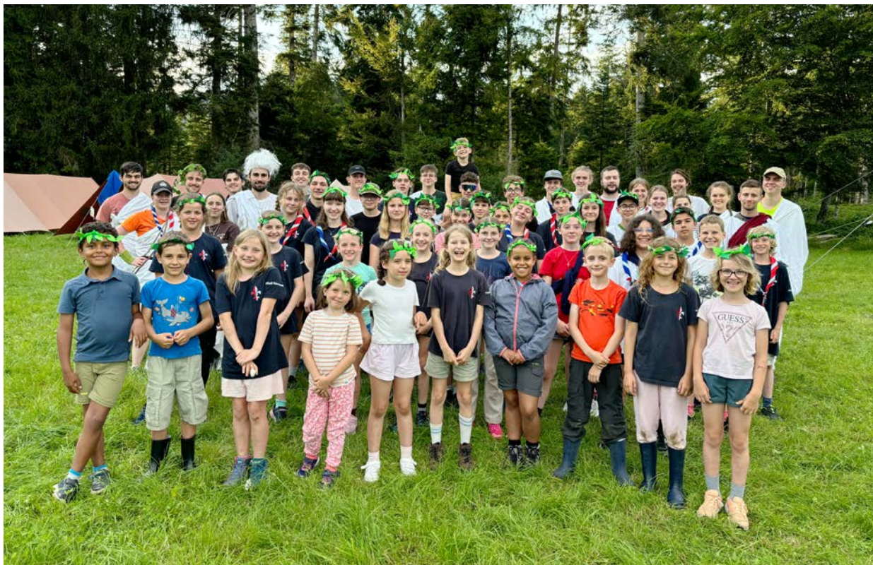
Eine muntere Truppe: die Stansstader Pfadi Schnitzturm während ihres diesjährigen Sommerlagers.

kaum Abbruch. So wurden denn auch die zweitägige Gruppenunternehmung und der Ausflug in die Badi für alle zum Genuss und sorgte für viele Spassmomente. Gleiches galt auch für die Taufe der insgesamt fünf neuen Pfädeler und Pfädelerinnen. Auf jeden Fall verflog die Zeit unglaublich schnell – und kaum hatte sich die eingeschworene Truppe so richtig im Pfadileben zurechtgefunden, hiess es auch schon wieder, Abschied zu nehmen. Und nach zwei Wochen Spiel und Spass in freier Natur ging's zurück in die zivilisierte Welt. Mit vielen schönen Gedanken im Hinterkopf. ■ rgj