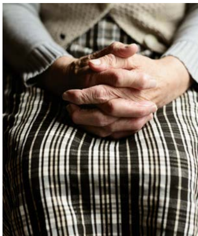
Nicht selten verzichten ältere Menschen aus Scham auf Ergänzungsleistungen.