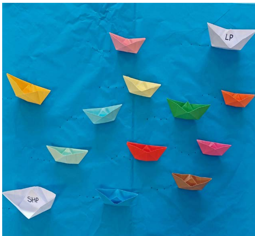
In einer Schule sind die Kinder mit unterschiedlichem Tempo unterwegs, gehen aber in die gleiche Richtung. Der integrative Ansatz besteht darin, dass sie von den Lehrpersonen (LP) und den Schulischen Heilpädagoginnen (SHP) so unterstützt werden, dass sie ihren Fähigkeiten entsprechend gefördert werden und das Beste aus ihren Möglichkeiten machen können. Illustration B. Küchler, Y. Murer

Damit in beiden Fällen diese Förderung funktioniert, ist eine enge Zusammenarbeit zwischen Lehrperson und Schulischer Heilpädagogin