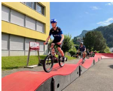
Pumptrack will gelernt sein. Deshalb gab's vor dem Start einige Instruktionen durch Profis.