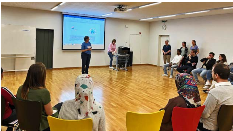
Die Rückmeldungen auf den DaZ-Abend waren durchwegs positiv.

Ich fände es super, wenn diese Thematik vertieft werden könnte, da nicht für alle klar ist, wie das schweizerische Schulsystem funktioniert und welche Optionen es für unsere Kinder gibt. Was die Schule Stansstad betrifft, bin ich sehr zufrieden. Alles ist gut organisiert und es gibt viele Angebote und Veranstaltungen für die Kinder, von denen wir einige nutzen, etwa den Mittagstisch, den Hort oder die Bibliothek. ■ rgi