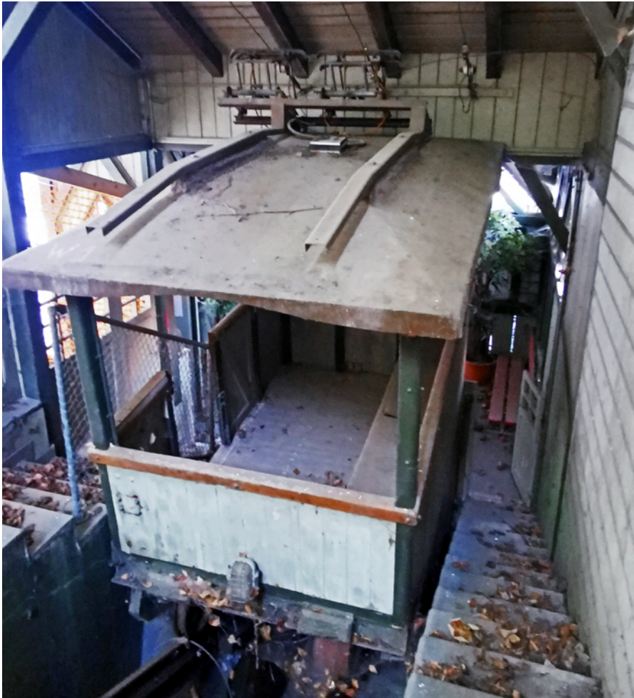
Das Trasse ver wachsen, die Farbe am Abblättern: Die Fürigenbahn fristet derzeit ein trauriges Dasein.

wusst sein, dass die Stationen sowieso unter Schutz stehen und erhalten bleiben müssten, daher mache es Sinn, auch die Bahn zu erhalten, denn ohne Bahn seien die Stationen ihrer Bedeutung und ihres Zwecks beraubt. Doch wer könnte überhaupt für die vermutlich immensen Kosten aufkommen? Dazu Dean Gelb: «Es ist klar, dass der Grundstückbesitzer / Verwalter sich an den Kosten bis zu einer gewissen realistischen Summe beteiligen wird, sollte das Projekt umgesetzt werden. Wie erwähnt stehen die Tellco AG und die VHV Immobilien hinter den Ideen der Interessengemeinschaft und sehen durchaus auch Potenzial im Projekt. Zudem möchten wir als IG aktiv werden und Spenden sammeln. Darüber hinaus werden wir die öffentliche Hand – Bund, Kanton, Gemeinde, aber auch Kulturstiftungen und Fonds anfragen, um die notwendigen Finanzen für die Sanierung und den Erhalt zusammenzubringen.»