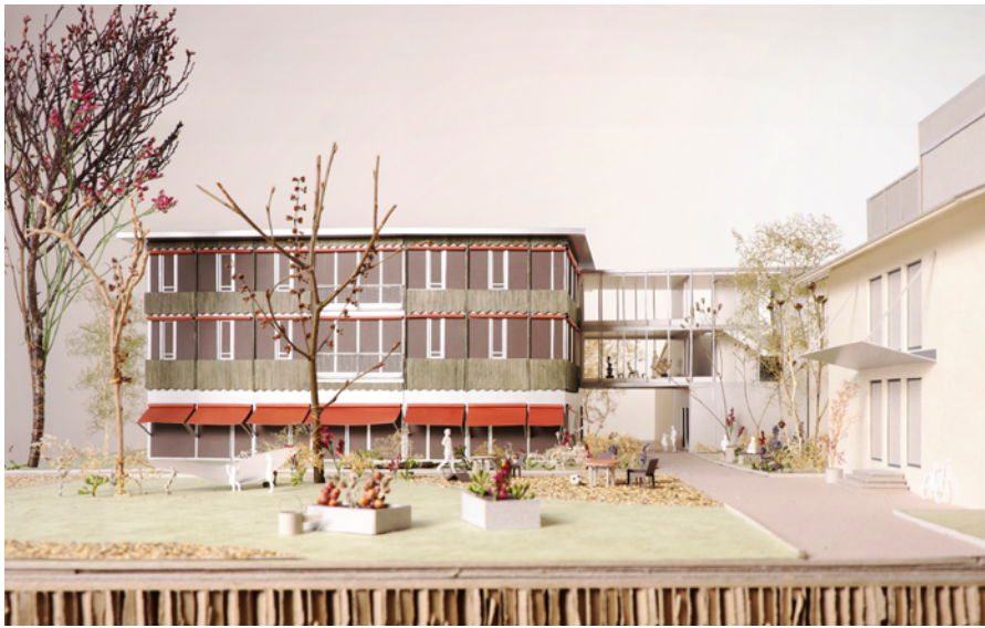
So wird sich der Anbau ans Primarschulhaus präsentieren. Visualisierung zvg

Die Arbeiten für die Erneuerung der Stansstader Schulliegenschaften sind einen Schritt weiter. Vor Kurzem hat der Gemeinderat den Jurybericht zur Kenntnis genommen und das Siegerprojekt zur Weiterbearbeitung freigegeben.