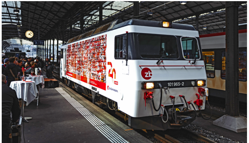
Die Jubiläumslokomotive der Zentralbahn.