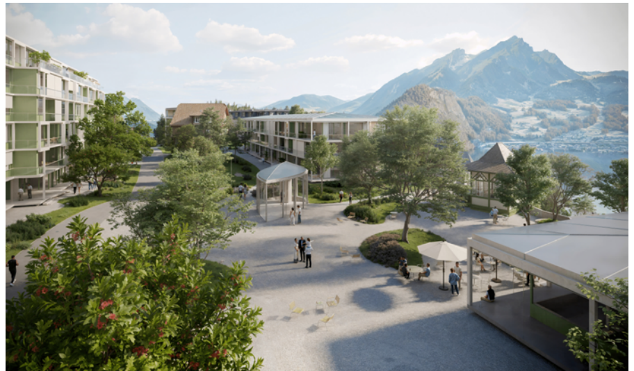
Die Bauten sind so angeordnet, dass attraktive Freiräume entstehen.

2017 wurden sechs Architektenteams eingeladen, am Studienauftrag teilzunehmen. Das Siegerprojekt der Buchner Bründler Architekten AG vermochte den architektonischen Auftrag und die gesetzlichen Vorgaben überzeugend zu erfüllen. Es sah zwei langgezogene Wohnbauten, ein Punkthaus, ein eingeschossiges Gastronomiegebäude, grosszügige Freiräume sowie den Erhalt der Bergstation der Standseilbahn sowie des historischen und ortsprägenden Bauernhauses vor. Im Rahmen der öffentlichen Auflage gingen beim Gemeinderat verschiedene Einwendungen gegen das Projekt ein. Insbesondere das lange Wohnhaus am Hang und die Grösse des Restaurants wurden kritisiert. Nicht alle Einwendungen konnten gütlich erledigt werden. Der Gemeinderat und die Grundeigentümerin entschieden sich darum, das Siegerprojekt zu überarbeiten.