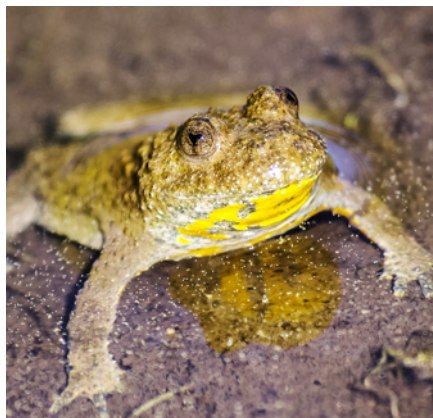
Die Gelbbauchunke wird beim Friedhof bald ein neues Paradies vorfinden.

Bereits im Verlauf des Frühjahrs sollen die Arbeiten für die ökologische Aufwertung an die Hand genommen werden. Der voraussichtliche Kostenrahmen für die Arbeiten beträgt 30'000 Franken. Das Projekt wird über den Landschafts- und Naturschutzfonds der Steinag Rozloch AG sowie einen Beitrag der Gemeinde Stansstad finanziert. ■ red