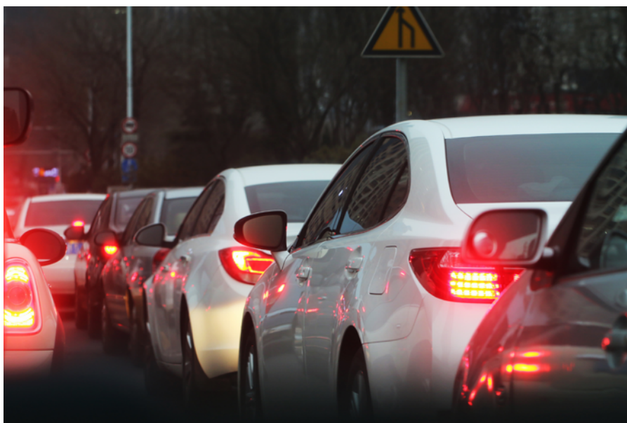
Ob das neue Dosiersystem auf der Autobahn den Umfahungsverkehr und damit Stau auf den Stansstadter Dorfstrasse verhindert, wird sich zeigen müssen. Symbolbild Pixabay

Doch wie genau funktioniert die Anlage? Dazu Oetterli: «Die Dosieranlage funktioniert kaskadenartig. Entwickelt sich etwa bei der Ausfahrt Hergiswil ein Stau, erfolgt an dieser Ausfahrt eine starke Dosierung, zudem erfolgt an der vorher-