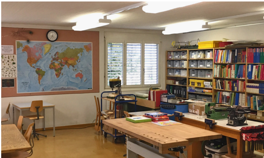
Blick in die Schulinsel Sarnen, die bereits seit mehreren Jahren erfolgreich betrieben wird. Ab kommendem Schuljahr wird auch Stansstad über einen solchen ergänzenden Lernort verfügen.

Mit der Genehmigung des Budgets 2025 wurde der Eröffnung einer Schulinsel (ergänzender Lernort) ab dem Schuljahr 2025/2026 zugestimmt. Diese ist vorerst immer vormittags geöffnet und steht ab dem kommenden Schuljahr grundsätzlich allen Kindern und Jugendlichen der Schule offen.