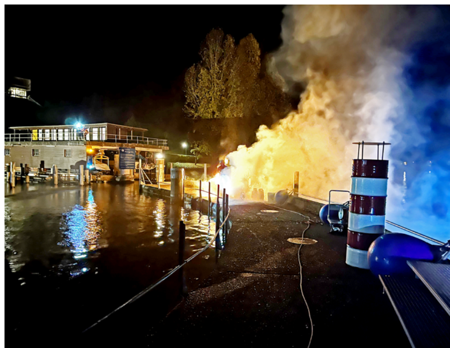
Ein wichtiger Bestandteil des Feuerwehralltags ist das Üben. Hier eine Übung in der Kehrsiter Hafenanlage beim Hotel Baumgarten.