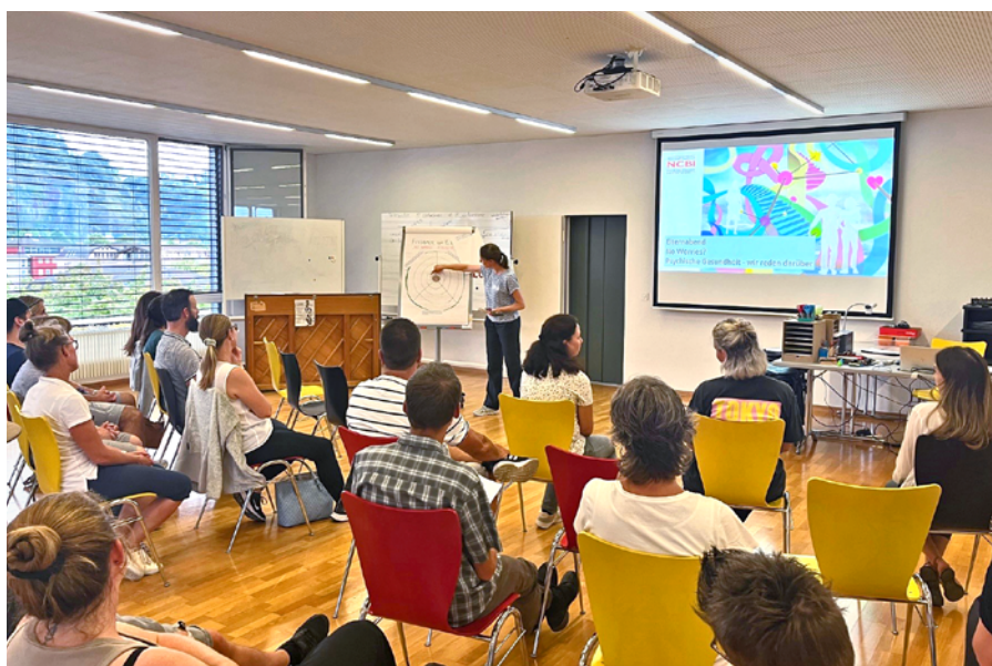
Zahlreiche Eltern liessen sich an einem Elternabend von Fachpersonen zum Thema psychische Gesundheit informieren.

Die Themen Stress und psychische Probleme werden an den Stansstader Schulen ernst genommen. Unter anderem mit schulischen Angeboten und einem Elternabend.