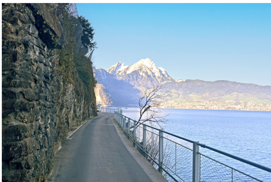
Mit dem neuen Nidwaldner Strassengesetz würde die Grundlage geschaffen, die Kehrsitenstrasse nicht mehr als Kantonsstrasse zu taxieren.

Der Entwurf des neuen Nidwaldner Strassengesetzes macht hellhörig. Er könnte dazu führen, dass die Kehrsitenstrasse an die Gemeinde übergeht. Mit entsprechenden Kostenfolgen.