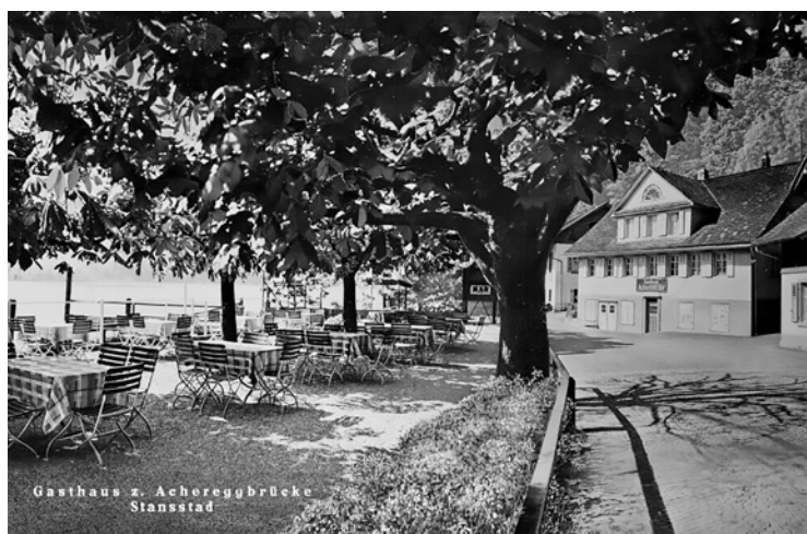
Das Fischerdorf Stansstad um 1930 und das lauschige Gartenrestaurant bei der Acheregg.