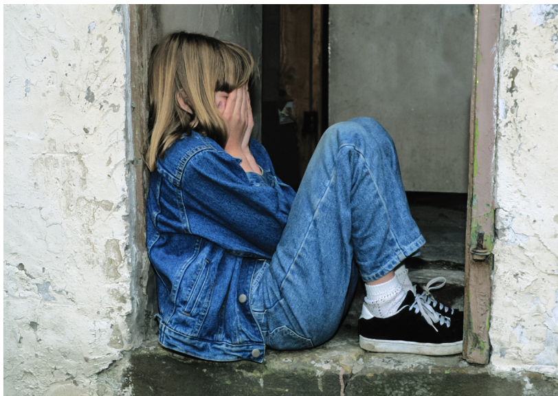
Kinder, die in einer schwierigen Situation sind, finden bei der Schulsozialarbeit Hilfe. Symbolbild Pixabay

Seit Februar 2022 ist Irène Odermatt in einem 50-Prozent-Pensum verantwortlich für die Schulsozialarbeit in Stansstad. «Da das Angebot auf Frei-