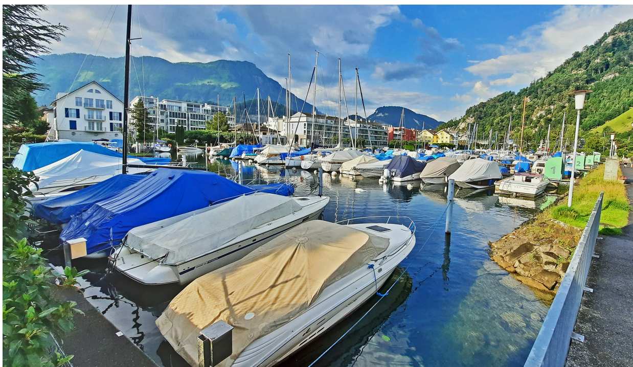
Die Sanierung der Hafenanlage musste nicht zuletzt wegen enormer Kostensteigerungen bei den Baumaterialien verschoben werden.

Für den Betrieb und die Sicherheit des Bootshafens stellt die Verschiebung kein Problem dar. Elvira Oggier: «Der Hafen wurde letztmals 1999 saniert und seither stets gut unterhalten.» Deshalb könne man – ebenso wie die Mieterinnen und Mieter – mit einem Bauaufschub gut leben. ■ rgi