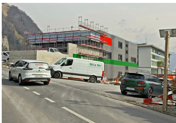
Der Neubau des Stansstadter Feuerwehr- und Werkhofgebäudes, das demnächst eingeweiht wird, schritt zügig voran. Die Bildserie zeigt den Baufortschritt im Februar 2021 (oben links), April 2021, Mai 2021 (Mitte links), September 2021, Januar 2022 (unten links) und März 2022.