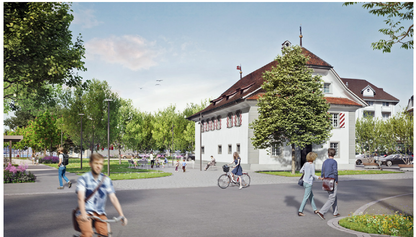
So dürfte sich der Stansstader Ortskern künftig präsentieren. Visualisierung zvg

Am 25. September wird sich entscheiden, ob sich das Stansstader Ortszentrum ab 2024 in einem neuen Kleid präsentieren wird. An diesem Tag ist die Urnenabstimmung zum Projekt Zentrumsfreiräume angesetzt. «Aufgrund des finanziellen Umfangs und der Tragweite des Projekts hat sich der Gemeinderat entschieden, über das Projekt nicht an der Gemeindeversammlung, sondern an der Urne abstimmen zu lassen», sagt dazu der zuständige Gemeinderat Andy Christen. Er hat sich in den vergangenen beiden Jahren gemeinsam mit einer breit abgestützten Arbeitsgruppe (sie umfasste u. a. Ortsparteien, Jugendanimation, Gewerbe/Gastrobetriebe) intensiv mit der künftigen Ausgestal-