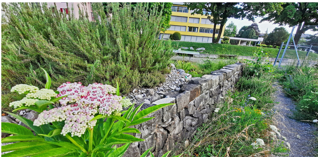
Ein Stück wilde Natur: Der Stansstader Schulgarten ist ökologisch äusserst wertvoll und bietet zahlreichen Tierarten Unterschlupf.

den Strukturreichtum und das magerere Substrat weisen die Flächen eine sehr hohe Pflanzenvielfalt auf. Zahlreiche Wildstauden sowie Straucharten finden sich auf den Flächen, die in der Normallandschaft selten geworden sind. Für Cyrill Kesseli ist dieses Fazit eine grosse Genugtuung. «Zwar ist die Vernetzung zu naturnahen Flächen am Bürgenberg oder am Alpnachersee weitgehend unterbrochen. Daher haben es weniger mobile Arten wie beispielsweise Reptilien schwer, die Anlage zu erreichen, doch sind auch sie vereinzelt anzutreffen.» Umso erfreulicher sei die grosse Vielfalt an mobilen Arten, insbesondere Insekten, die von der Blütenvielfalt profitieren. Dies zeige die hohe Qualität und den grossen Wert der Fläche auf. «Dass die Artenvielfalt der Bienen aber sogar kantonsweit zu den grössten gehören würde, überrascht auch mich», so Kesseli. «Ich hoffe deshalb, dass sich heute auch die damals vielleicht teils skeptischen Beobachterinnen und Beobachter an der grossen Artenvielfalt und Fülle auf den Flächen beim Stansstader Schulhaus freuen.» ■ rgi