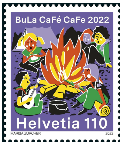
Die Sondermarke der Post unterstreicht die Wichtigkeit des Bundeslagers, das lediglich alle rund 14 Jahre stattfindet.

Aber 2022 passt alles und wie die ganze Pfadi Schnitzturm freut sich Ella Kopp riesig auf den Anlass, «für