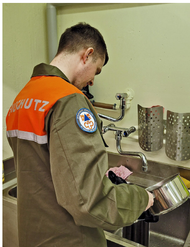
In einer ersten Phase spielte der Nidwaldner Zivilschutz in der Stansstader Erstaufnahmestelle eine wichtige Rolle.