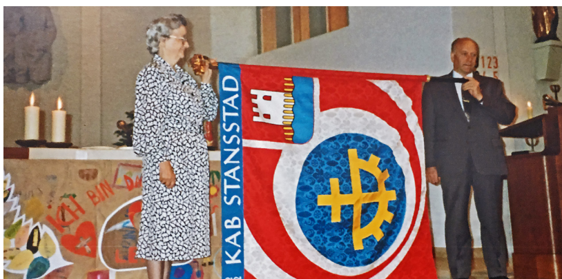
Vor 30 Jahren wurde die KAB-Fahne in der Kirche geweiht.