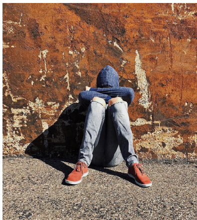
Vor allem junge Menschen haben in der Corona-Pandemie gelitten.