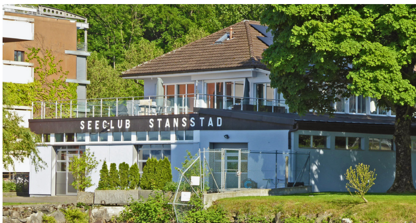
Auch die Erneuerung des Seeclub-Bootshauses wurde nicht zuletzt dank der Unterstützung des REV möglich.

Mit dem Projekt soll die Grundlage dafür geschaffen werden, dass Maria