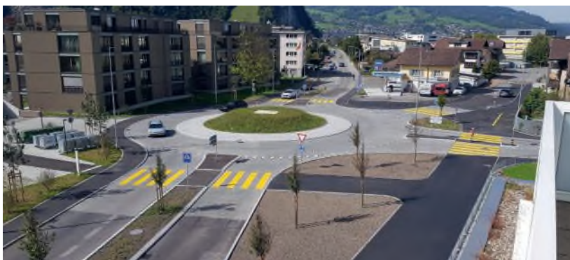
Im Frühjahr wird beim Kreisel Schürmatt der Deckbelag eingebaut.

Die Arbeiten beim neuen Kreisel Schürmatt sowie beim Ausbau der Bürgenstockstrasse sind bis auf den Deckbelag abgeschlossen. Dieser soll im Frühling 2022 eingebaut werden. Für die Gestaltung des neuen Kreisels Schürmatt sind im Budget 2022 der Gemeinde 150'000 Franken vorgesehen. Über die Art der Gestaltung sowie über den Verfahrensablauf wird sich der Gemeinderat anfangs 2022 auseinandersetzen. ■ red