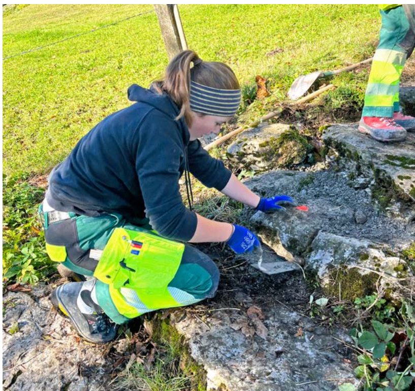
14 Lernende und zwei Betreuer der Giswiler Garten- und Tiefbaufirma Markus Enz AG besserten im Herbst in Obbürgen Wanderwege aus.

14 Lernende und zwei Betreuer der Giswiler Garten- und Tiefbaufirma Markus Enz AG waren im vergangenen Herbst oberhalb von Obbürgen im Gebiet Widenrain und Schiltgrat im Einsatz. Gemeinsam mit Leuten vom Stansstader Werkdienst brachten sie einen Teil des Wanderwegnetzes wieder in Ordnung. Nach der morgendlichen Vorbesprechung der Arbeiten ging es an die Pickel und Schaufeln. Unter anderem wurden Treppenstufen neu gesetzt und Wege abgerandet. Beim Projekt ging es nicht bloss um die Instandstellung der Wanderwege. Vielmehr hatte der Anlass auch einen sozialen Aspekt: Die Lernenden der ENZ AG konnten sich besser kennenlernen, kamen sie doch von verschiedenen Firmenstandorten. Als Dank gab's zum Zmittag eine kulinarische Belohnung in Form von Bratwurst, Kartoffelgratin und einem kleinen Dessert. ■ rgi