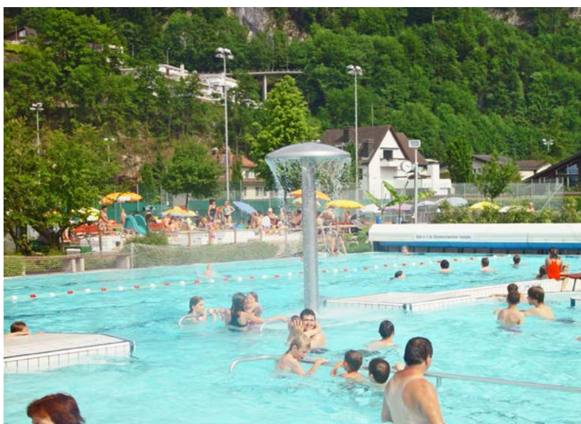
Heute so beliebt wie früher (hier eine Aufnahme aus dem Jahr 2005): Seit bald zwei Generationen zieht die Stansstader Badi viel Volk an.

In den kommenden Ausgaben von Stansstad aktuell wird über den jeweils aktuellsten Stand der Planungen und Arbeiten berichtet.