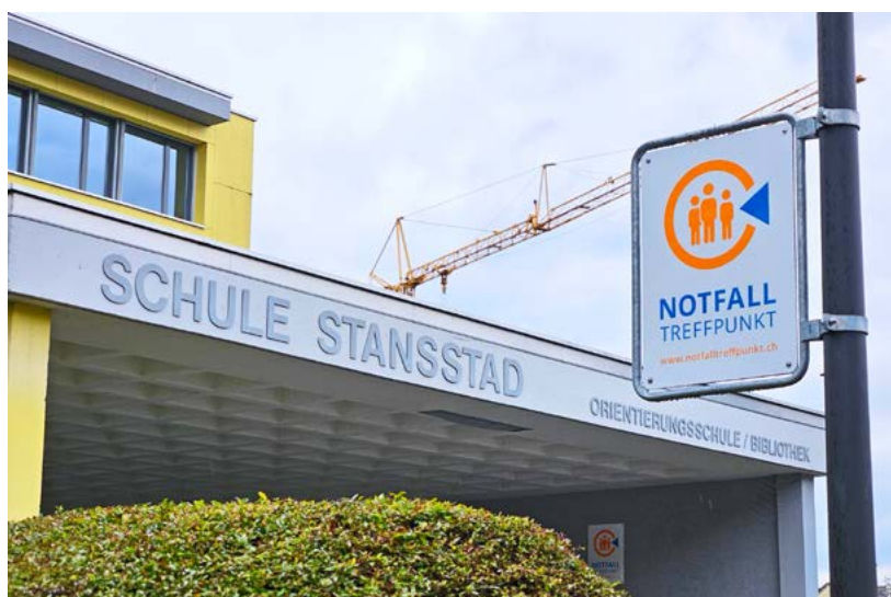
Der Notfalltreffpunkt befindet sich beim Stansstader ORS-Schulhaus.

«Für diesen Fall haben die kantonalen Organe des kantonalen Führungsstabes und des Bevölkerungsschutzes ein Konzept für die Notkommunikation erarbeitet», erklärt Fritz Stauffer, Leiter des Gemeindeführungsstabes (GFS) Stansstad. Zentralelemente sind dabei die Notfalltreffpunkte in sämtlichen Gemeinden. Die Einwohnerinnen und Einwohner wurden mit