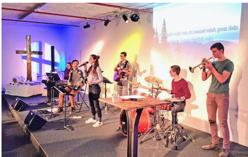
Die Gottesdienste des Christlichen Treffpunkts an der Rotzbergstrasse 1 in Stansstad sind häufig musikalisch umrahmt.

Was die Merkmale des CT Nidwalden betrifft, das sich über freiwillige Spenden der Gemeindeglieder finan-