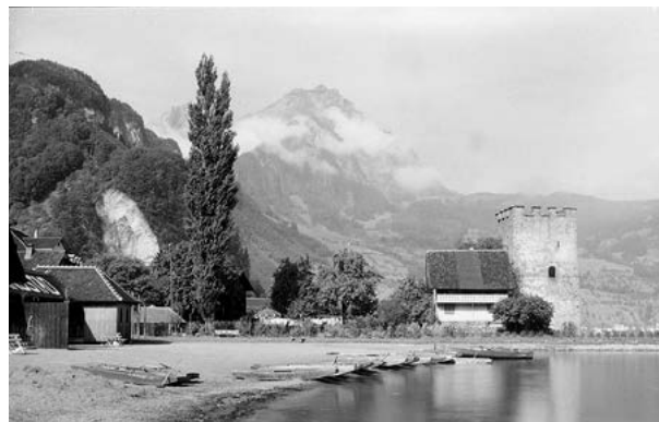
Natur pur, so sah das Areal der heutigen Badi um die vorletzte Jahrhundertwende aus, bevor in den dreissiger Jahren die erste Badi erstellt wurde.