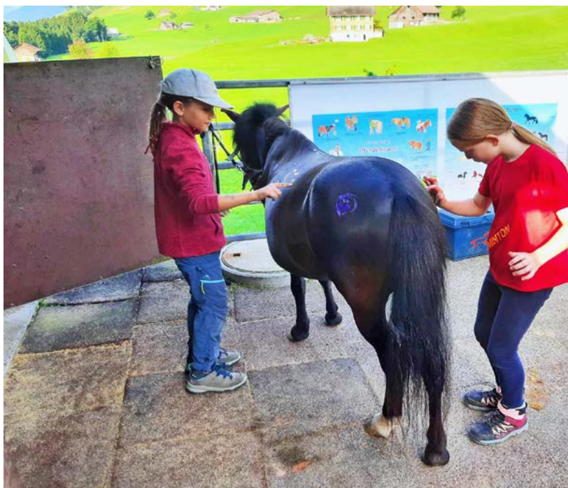
Geschicklichkeit wird auf dem Obbürgen Ponyhof ebenso geübt wie der richtige Umgang mit den Tieren.