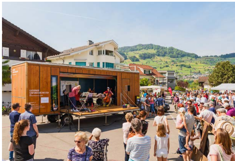
Im Juni macht der LSO-Musikwagen (hier ein Bild aus Buochs) Halt in Stansstad. Gute Unterhaltung ist garantiert.

In der ersten Juniwoche findet eine Projektwoche statt, die den Stansstader und Obbügger Schülerinnen und Schülern der Musikschule und der Primarschule die Musik direkt in den Schulalltag bringen wird. Vom 3. bis 7. Juni erhalten sie nämlich eine Auftrittsmöglichkeit der ganz besonderen Art. Der Musikwagen des Luzerner Sinfonieorchesters (siehe Kasten) wird als mobile Bühne auf den Pausenplätzen in Stansstad (3., 4., 6. und 7. Juni) und in Obbürgen (5. Juni) stationiert sein. Schülerinnen und Schüler des Kindergartens, der Primarschule und der Musikschule präsentieren Darbietungen jeglicher Art in Form von «Pausenplatzkonzerten».