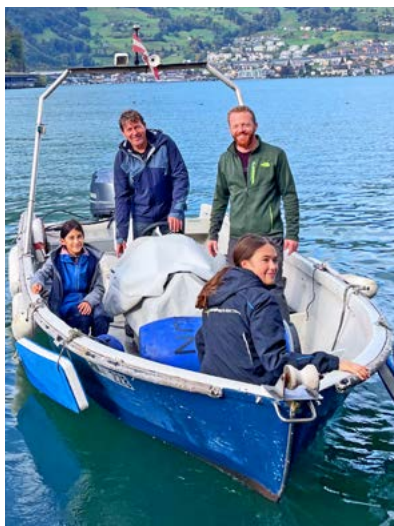
«Bobo» – das klubeigene Motorboot.

ze-Boote haben eine Besatzung von vier Personen und kommen vor allem im Regattasport zum Einsatz. Aber auch die Geselligkeit kommt im Jahresverlauf des Segelklubs nie zu kurz. «Wir haben ein sehr reges Vereinsleben», betont Präsident Thomas Hasler. Das erstaunt insofern nicht, als der