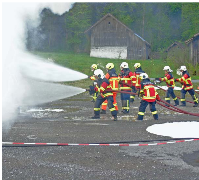
Das Feuerwehrhandwerk will gelernt sein. Deshalb wird im April in Stansstad ein fünftägiger Gruppenführerkurs für angehende Feuerwehrikader durchgeführt.

rer jeweiligen Ortsfeuerwehr das Wissen weiterzutragen. «Wir geben ihnen den Rucksack auf den Weg, damit sie – neu als Unteroffiziere – ihre Kameradinnen und Kameraden schulen und das Gelernte weitergeben können», umreisst der Ausbildungsleiter den Sinn und Zweck des Kurses. Er betont, dass alle 80 Feuerwehrmänner und -frauen den Kurs freiwillig besuchen und dafür ihre Freizeit hergeben. Dies gilt auch für das Lehrpersonal und das Hilfspersonal. «Die einen nehmen Ferien, andere kompensieren Überzeit – das zeigt, dass wir es hier mit motivierten Menschen zu tun haben, die sich gerne für die Sache und unser Milizsystem einsetzen.» ■ rgi