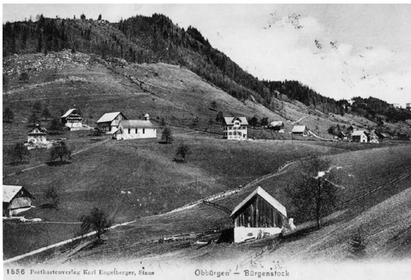
1910 stand das drei Jahre zuvor erbaute Obbürgen Schulhaus (Bildmitte) mitten auf der grünen Wiese rechts neben der damaligen Kapelle.

Der Kindergarten und die «Handarbeit» wurden weiterhin im alten Schulhaus unterrichtet. Seit 2020 besuchen die Kindergärtler den Unterricht jedoch im neuen Schulgebäude. Im Schulhaus von 1906 findet nur noch der Unterricht für die Kinder der Spielgruppe statt. Die Wohnung wird vermietet, sonst steht das Schulhaus seither leer – bis im neuen Schuljahr wieder Leben einkehren wird. ■ rgi