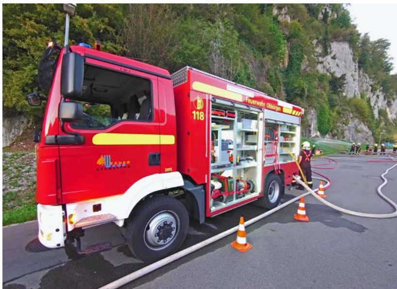
Die Stansstader Feuerwehr wurde 2023 zu insgesamt 15 Ernstfällen aufgeboden. Daneben stand vor allem die Aus- und Weiterbildung im Fokus.

Ernstfälle gab es demnach deren 15. In sieben Fällen handelte es sich um einen Brand, fünfmal waren technische Hilfeleistungen notwendig, zweimal war die Ölwehr im Einsatz und in einem Fall war es ein Elementarereignis. Insgesamt waren die Stansstader Feuerwehrleute 608 Stunden im Einsatz.