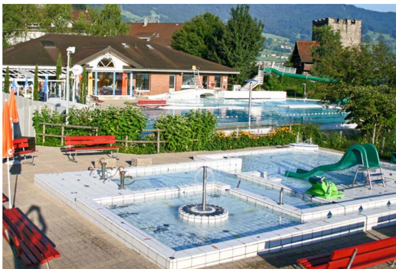
Nach der Eröffnung vor fast 40 Jahren drängt sich eine umfassende Sanierung der Badi Stansstad auf, damit sich auch künftige Generationen daran erfreuen können.

Rund 40 Jahre nach der Eröffnung der Badi Stansstad werden derzeit die Weichen für die Zukunft der prächtigen Anlage am Stansstader Seeufer gestellt. «Bereits seit Längerem beschäftigt sich der Stansstader Gemeinderat mit der Thematik», sagt die für die Badi zuständige Gemeinderätin Lisbeth Koch. Um eine seriöse Entscheidungsgrundlage zu haben, hat die Gemeinde ein umfassendes Nutzungskonzept ausarbeiten lassen, in das auch die Meinungen der Bevölkerung sowie von Fachleuten eingeflossen sind (siehe Kasten unten). «Da es sich beim Umbau der Badi um eine Investition in die Zukunft handelt, haben wir – sowohl was eine Sommerwie auch eine Winternutzung betrifft – sämtliche möglichen Optionen geprüft», betont Lisbeth Koch (siehe Kasten). Da die entsprechenden Kostendimensionen jedoch teilweise immens sind, hat sich der Gemeinderat im vergangenen Sommer für eine fi-