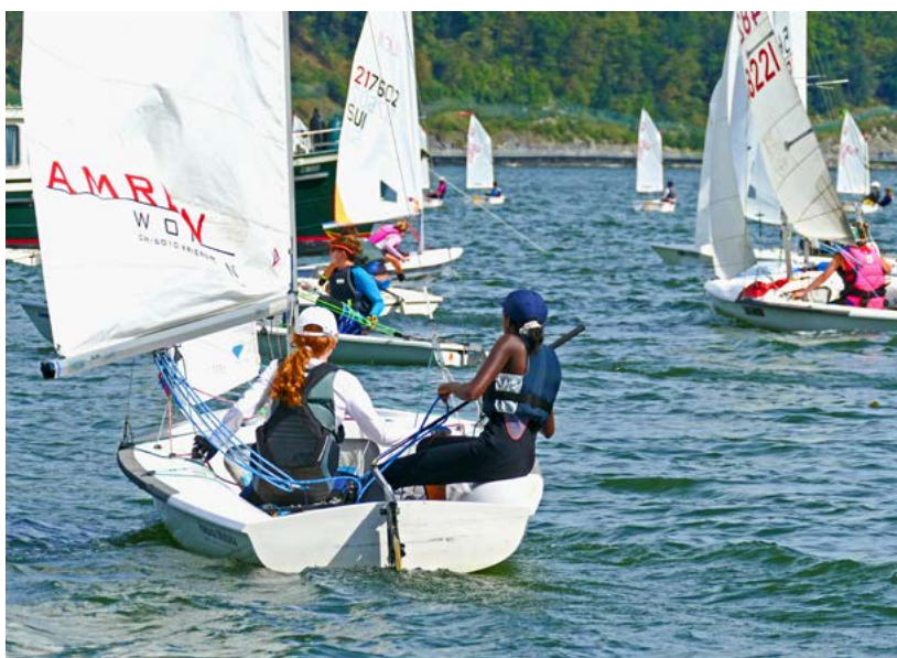
Mit dem Regiocup auf dem Alpachersee (hier ein Bild aus dem vergangenen Jahr) bietet der Segelklub jungen Seglerinnen und Seglern die Möglichkeit, sich im Wettkampf zu messen.

Sämtliche Informationen zum Segelklub Stansstad finden sich auf dessen Website: www.segelklub-stansstad.ch .